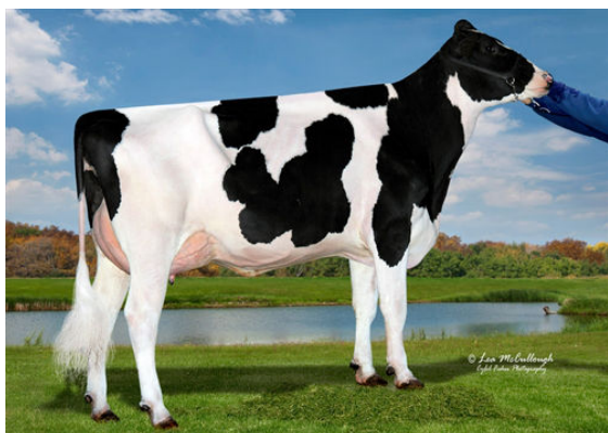
OCD DOORMAN 9689 THIRD DAM