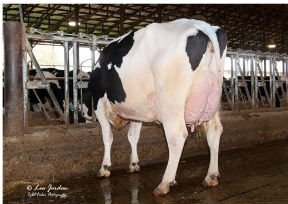
OCD DELTA 33343 GRANDDAM